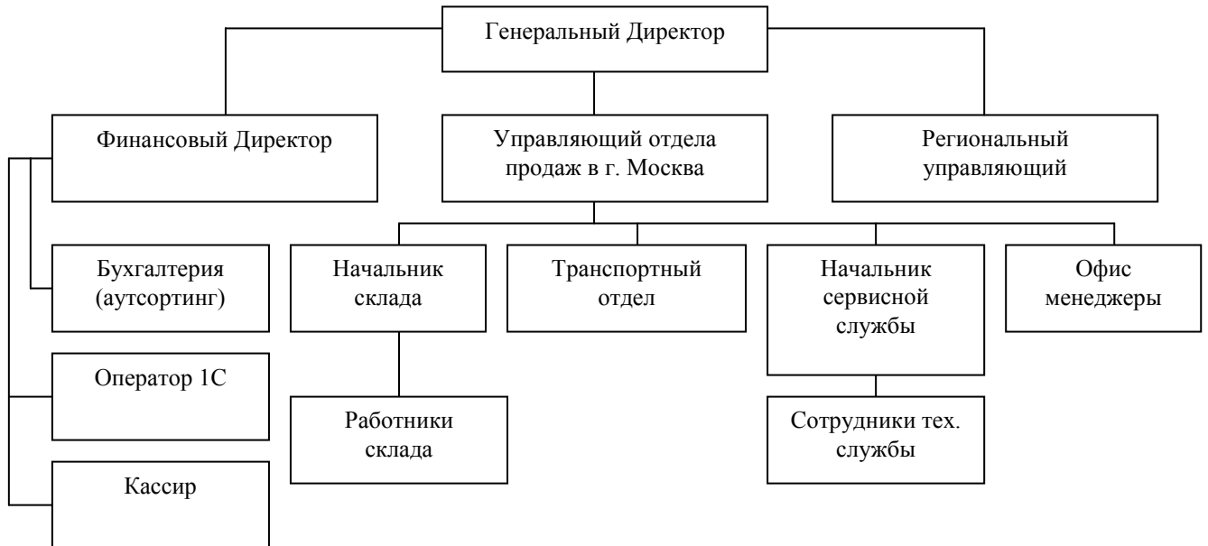
Рис. 2. 1. Организационная структура управления ООО «XXX»