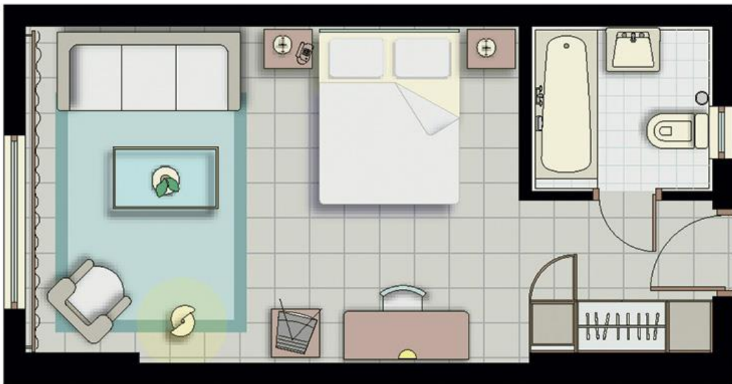
Схема гостиничного номера категории «стандарт»